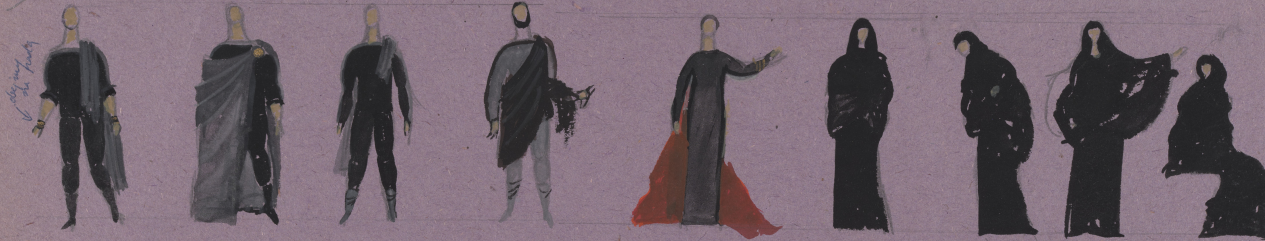
IPHIGENIA KREON TALTYBIOS AGAVE MEDEA KOBIECY KORINTYJSKIE