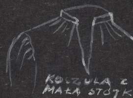
KOSZULA Z MALĄ STÓTKA