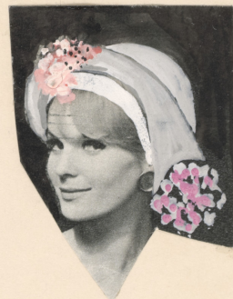
FORMA KAPELUSZA DO UZGODNIENIA